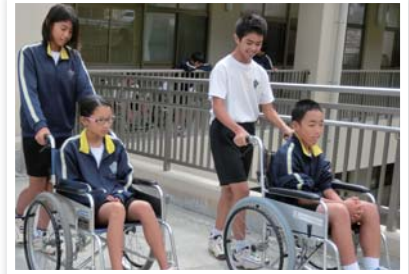
（福祉教育の車いす体験の様子）

賛助会員 ー□ 1,000 円 平成 26 年度実績総額 (特別会員 ー□ 5,000 円) 1,729,568 円 (1,366 件)