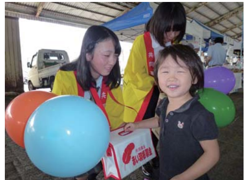
尾鷲イタダキ市での共同募金運動の様子