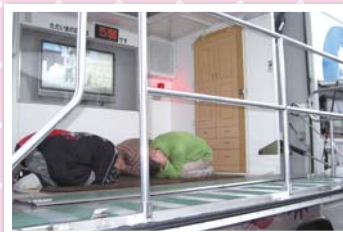
昨年度訓練の様子