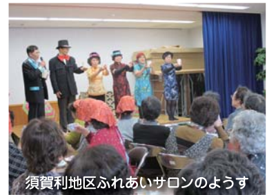
須賀利地区ふれあいサロンのようす