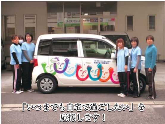
「いつまでも自宅で過ごしたい」を応援します！