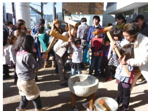
もちつき大会の様子