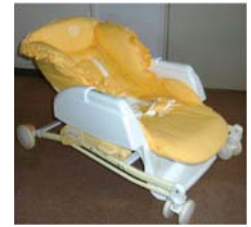
スウィングチェア