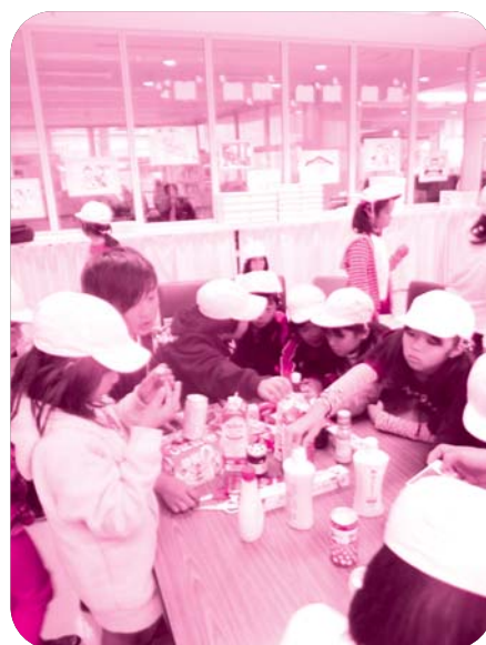
福祉教育の推進 小学生のユニバーサルデザイン体験

「尾鷲で安心して心豊かに暮らしたい」というみんなの想いを具現化していくため、本社協の基本理念である「誰もが安心して生活できるまちづくりを進めていく」をモットーに、地道かつ有効的に地域福祉活動に取り組むとともに、広報・啓発活動の強化を含め、さらなる地域福祉の充実をめざし、意欲的に取り組んでいきます。