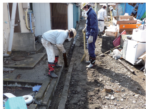
沿岸部は壊滅。瓦礫撤去が進んでおらず、360度瓦礫の山。

尾鷲市社会福祉協議会では、今後も職員派遣 ニーズがあれば、引き続き職員を派遣し、被災 地支援を行っていく予定です。