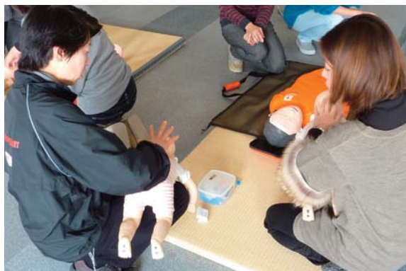
⇔「気道異物の除去」の実習中