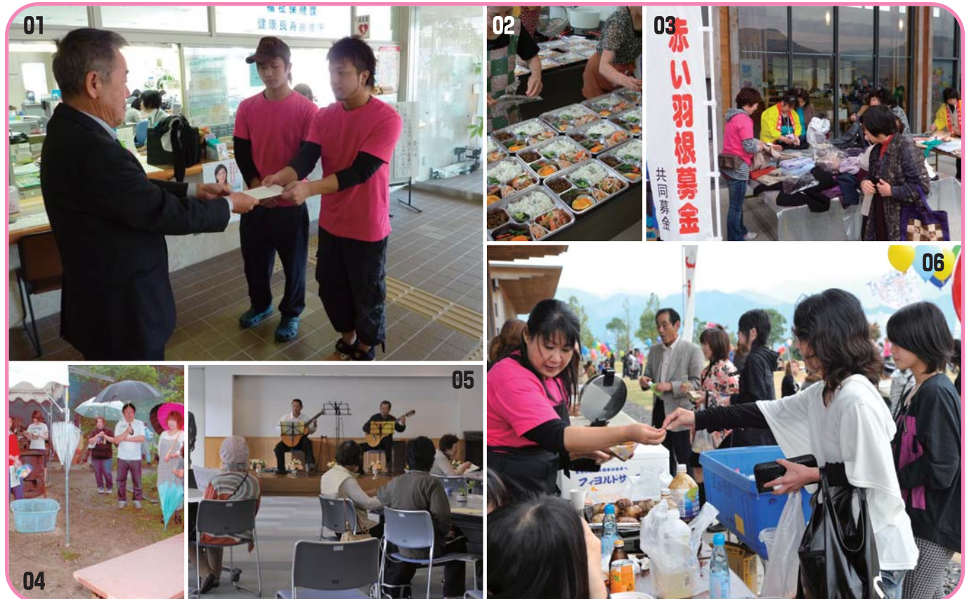
01) 赤い羽根イベント出店での上金寄付 (任意団体KODOMO様) 02) 心のこもったお弁当をお届け 03) 赤い羽根イベント (バザー売上募金) 04) 世代間交流で人の輪を 05) あったかふれあいサロン 06) 赤い羽根イベント出店